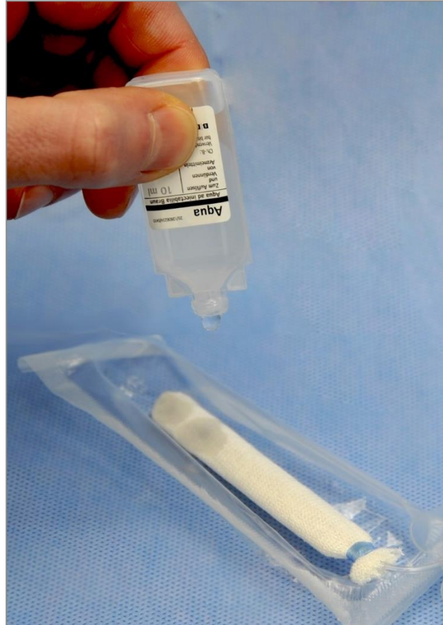
Befeuchten der Tamponade mit Aqua dest.