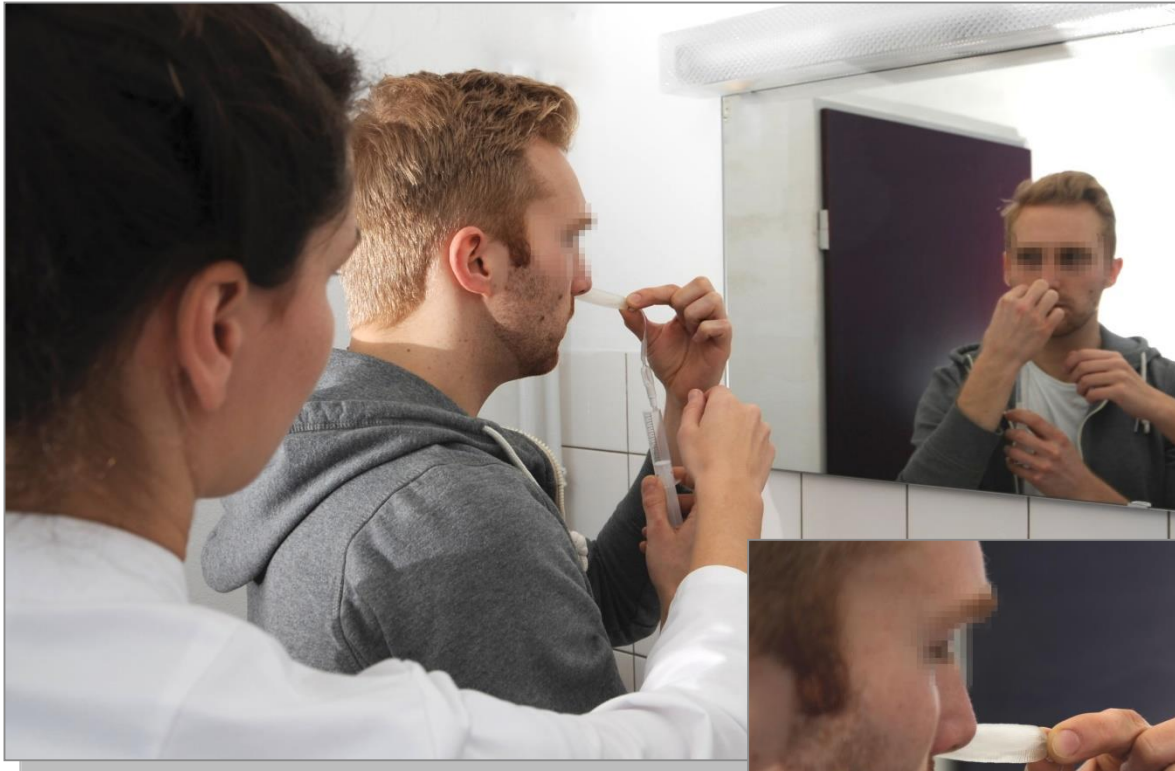
Einführen der Tamponade unter ärztlicher Anleitung