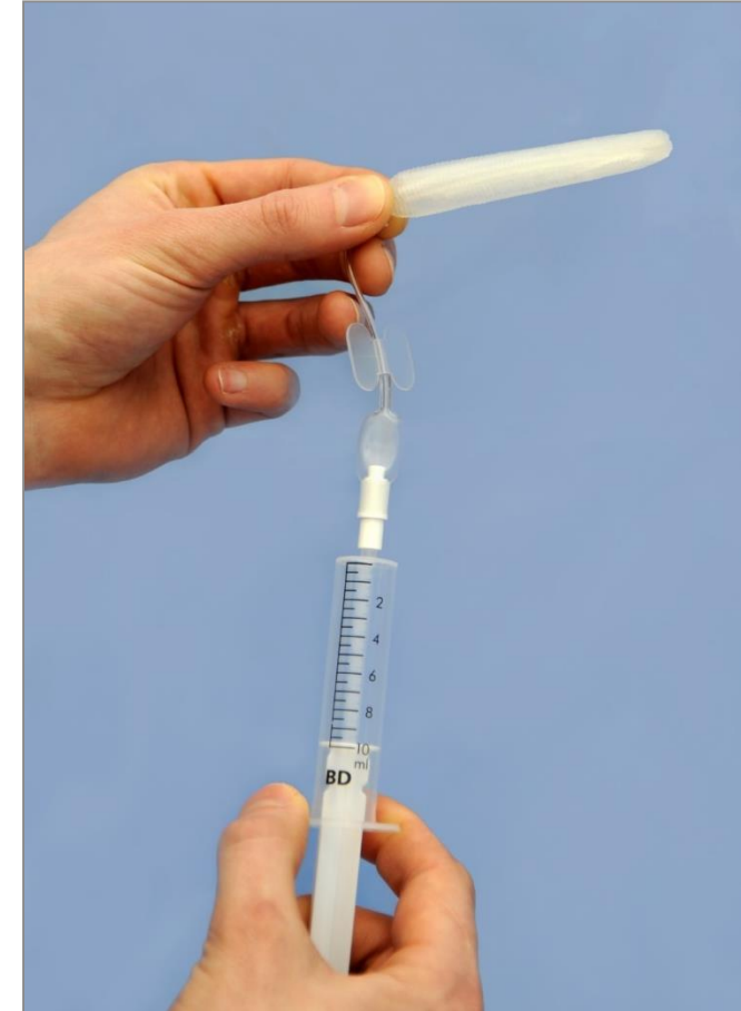
befeuchtete Tamponade mit luftgefüllter 10ml Spritze