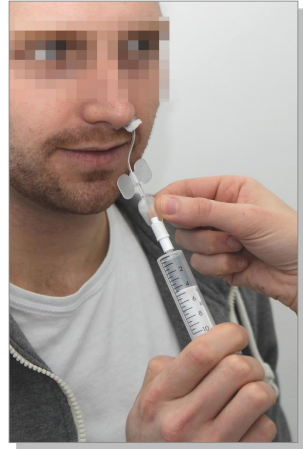
Aufpumpen der Tamponade mit Luft