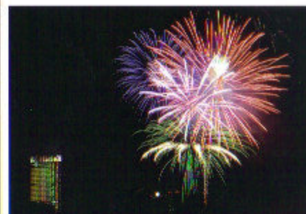
Rhein in Flammen 2008 bei Bonn