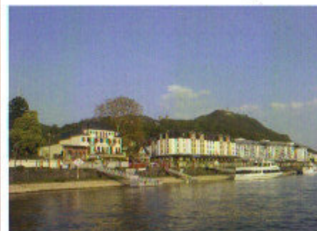
Königswinter am Rhein mit Drachenburg und Schloss Drachenfels